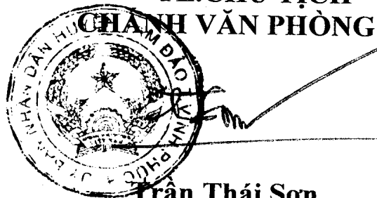
Trần Thái Sơn